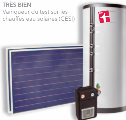
Kit solaire vainqueur du test - CESI TOPline 2 capteurs EURO C20AR, ballon ECOplus 300 l.